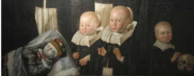
MEMENTO MORI: Utsnitt fra Gabelsen-epitafiet fra Innvik kirke i Nordfjord. Gutten med hodeskallen nederst i høyre hjørne er et typisk eksempel på memento mori , sier fagdirektør i Universitetsmuseet i Bergen, der bildet nå henger.