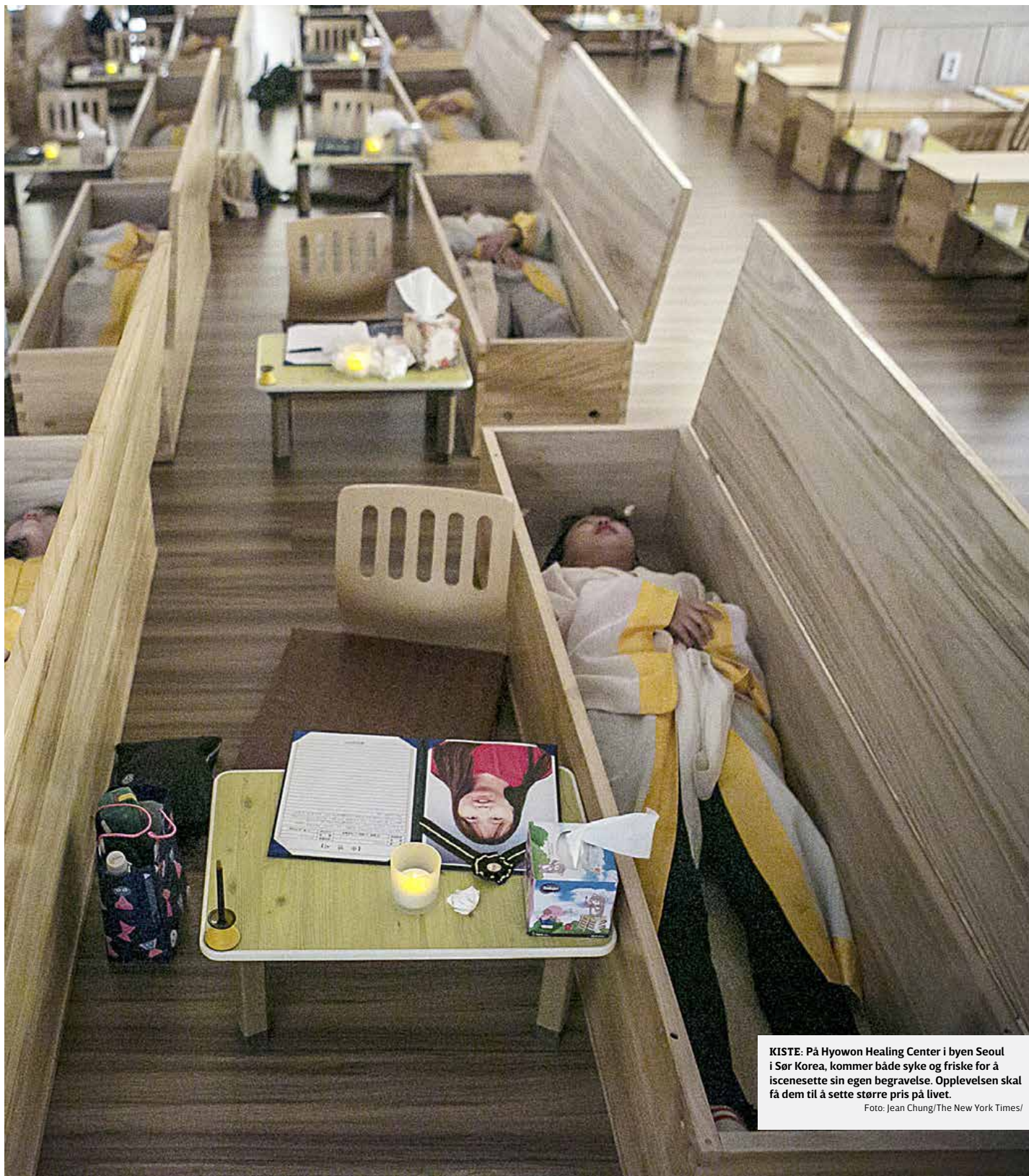
KISTE: På Hyowon Healing Center i byen Seoul i Sør Korea, kommer både syke og friske for å iscenesette sin egen begravelse. Opplevelsen skal få dem til å sette større pris på livet.